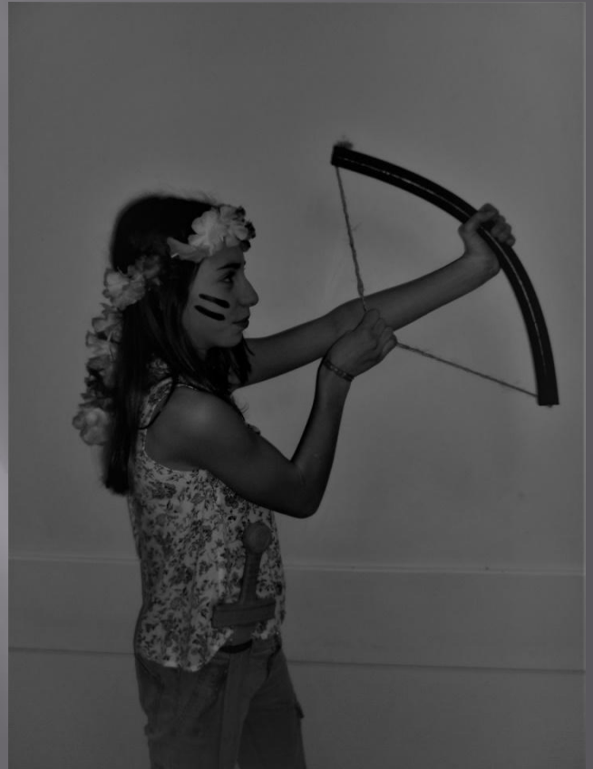
TLEMA, LA GUERRIERE

Un an plus tard, elle croisa Thésée et tomba amoureuse de lui. Tléma décida de le suivre dans ses aventures.