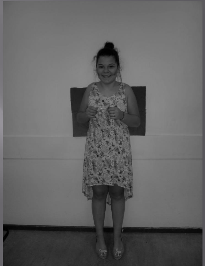
KALA ET LA CLE DE POSEIDON

A l'âge de dix ans, Kala sauva la ville de son enfance d'une vague immense qui la menaçait, grâce à une clé en forme de poisson qui possédait le pouvoir de contrôler la mer. La vague fut arrêtée et repoussée.