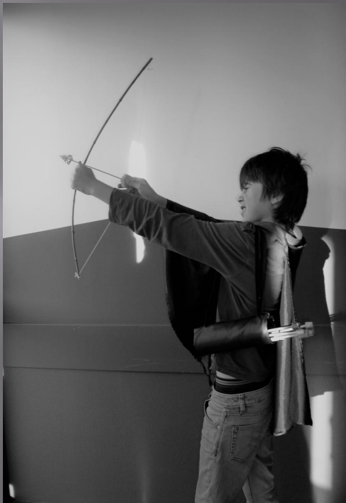
PYROTOXON TUANT LE GEANT DE LA MONTAGNE

Après plusieurs heures de marche, il parvint au sommet et vit le géant qui protégeait un arc de feu. Le géant l'attaqua, mais Pyrotoxon l'esquiva et lui planta une flèche dans l'œil. Le géant, hurlant, essaya de l'écraser, mais il ne réussit qu'à blesser le fils d'Apollon. Celui-ci aveugla le monstre en lui tirant une flèche dans l'autre œil. Pyrotoxon s'empara de l'arc enflammé et s'en servit pour brûler le géant.