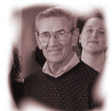
Louis Bülow ©2015-17